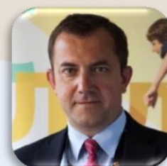
Огнян Златев Ръководител на Представителството на Европейската комисия в България