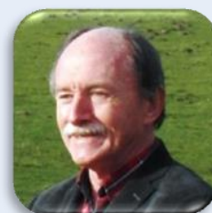
Леен Ревалиер Холандия